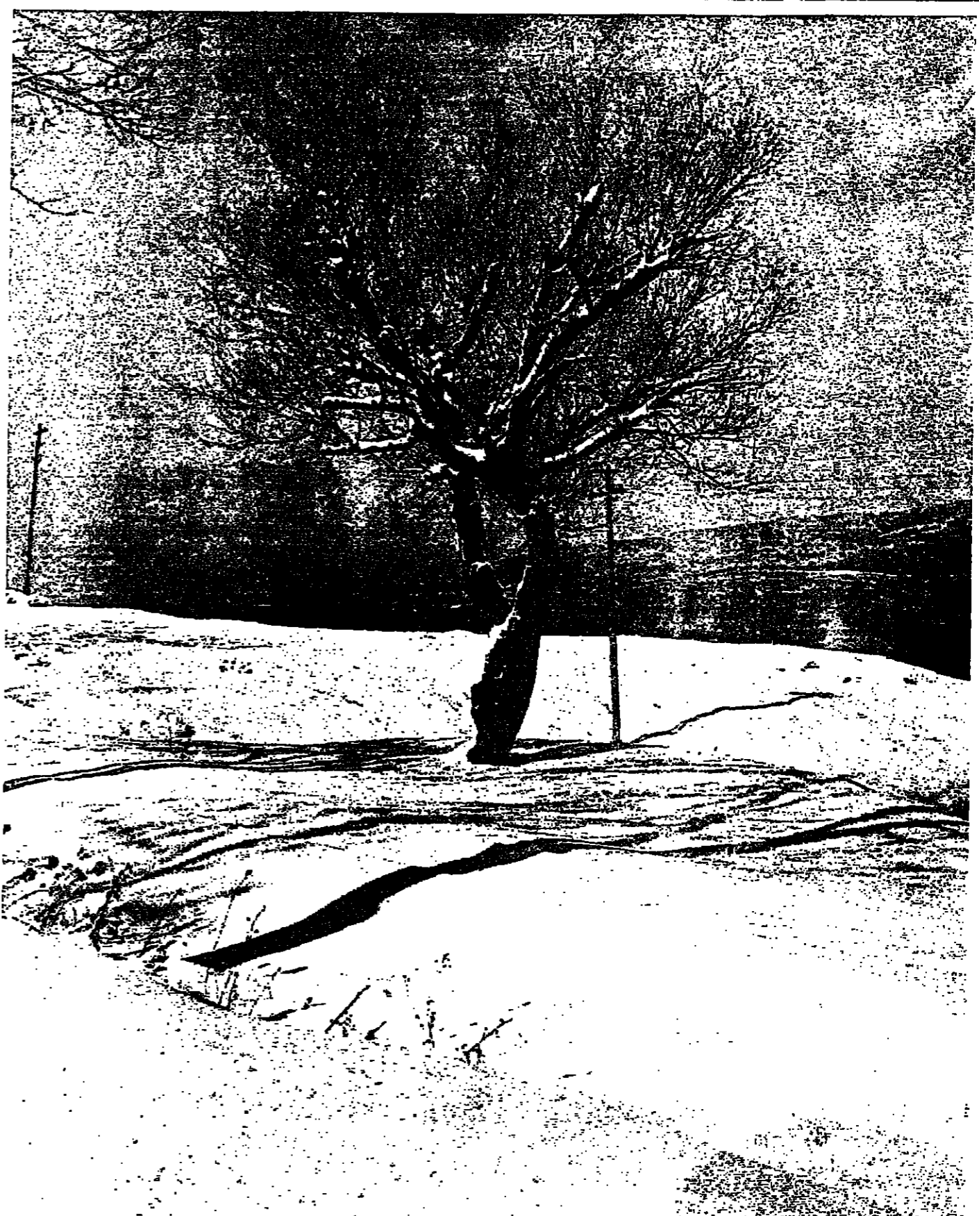
■ اشجار الجبل اعطت اسمها للثلج . فتعرت وارتفعت اغصانها تستقبل الصقيع الهاجم . مع ذلك ، فهي حزينة ، هجرها الناس .. والطيور ... والحيوانات الاليفة ■